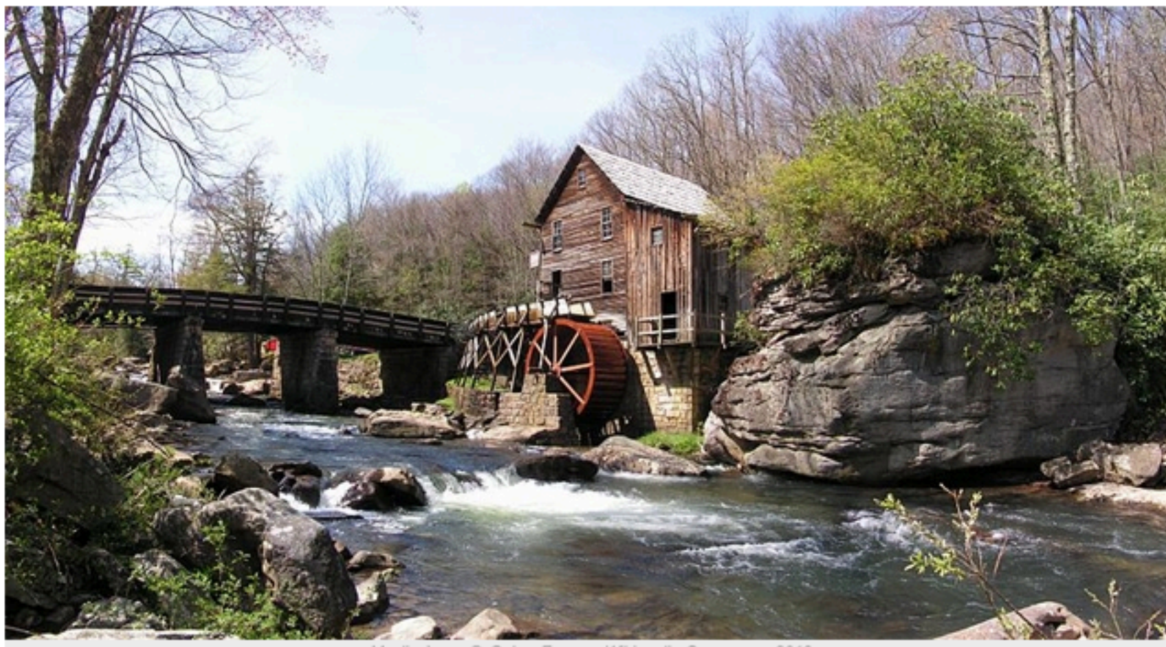
Moulin à eau

L'association de sauvegarde des moulins à eau dénonce : assurer la continuité écologique reviendrait à combattre la morphologie actuelle des rivières qui est l'héritage de plusieurs siècles. Et à détruire des moulins ou en tout cas à supprimer les canaux de dérivation qui empruntent de l'eau aux rivières pour la restituer en amont, après NE PAS avoir fait tourner la roue bien souvent puisque les roues ont la plupart du temps été démontées.